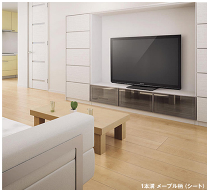
1本溝 メープル柄 (シート)