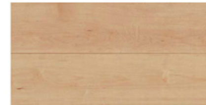
メープル柄 (シート) [JY]