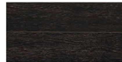
スモークオーク柄 (シート) [GY]