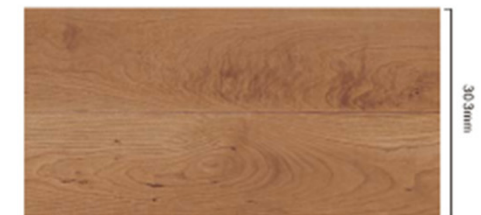
チェリー柄 (シート) [CY]