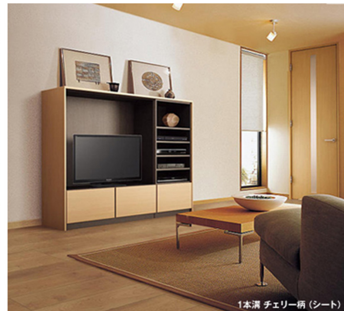
1本溝 チェリー柄 (シート)