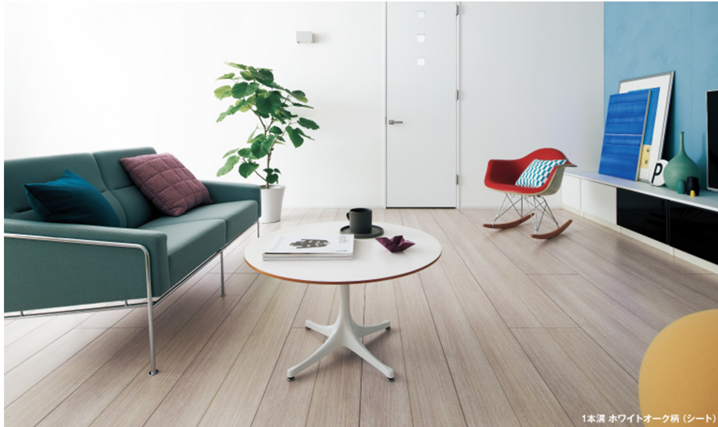
1本溝 ホワイトオーク柄 (シート)