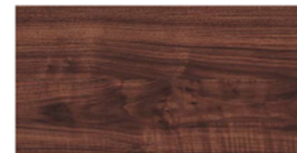
ウォールナット柄 (シート) [FY]