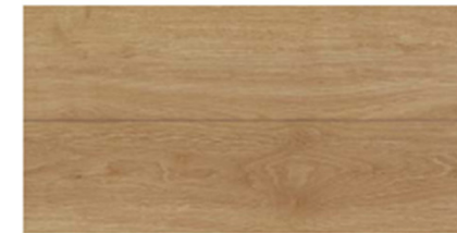
オーク柄 (シート) [EY]