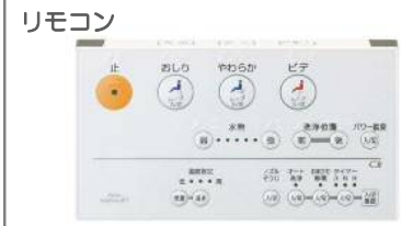
画像はイメージです